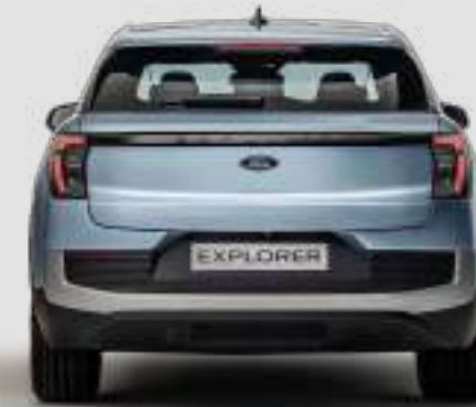
Szerokość całkowita z lusterkami: 2063 mm