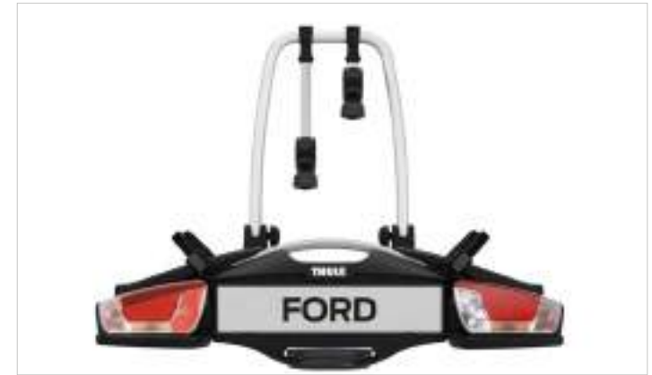
THULE®* MOCOWANY Z TYŁU POJAZDU BAGAŻNIK ROWEROWY (2 353 442) 3 063 zł