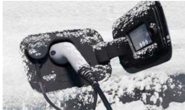
OSŁONA PORTU ŁADOWANIA (2 730 817) 115 zł