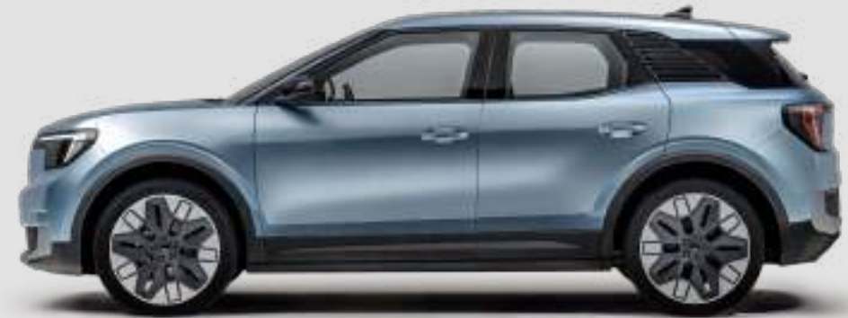
Długość całkowita: 4468 mm