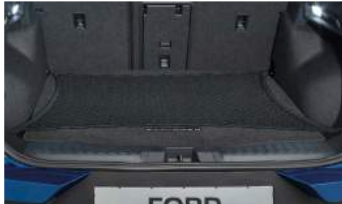
SIATKA PRZYTRZYMUJĄCA BAGAŻ (2 772 747) 304 zł