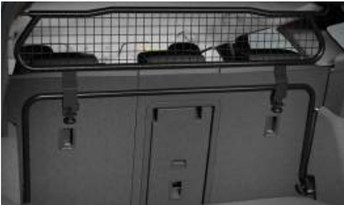
KRATKA OCHRONNA (2 718 464) 2 066 zł