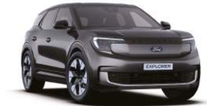
MAGNETIC GREY - LAKIER SPECJALNY 3 000 zł