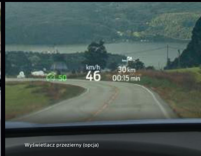
Wyświetlacz przezierny (opcja)

Nowy Ford Explorer w wersji Premium z opcjonalnym wyposażeniem