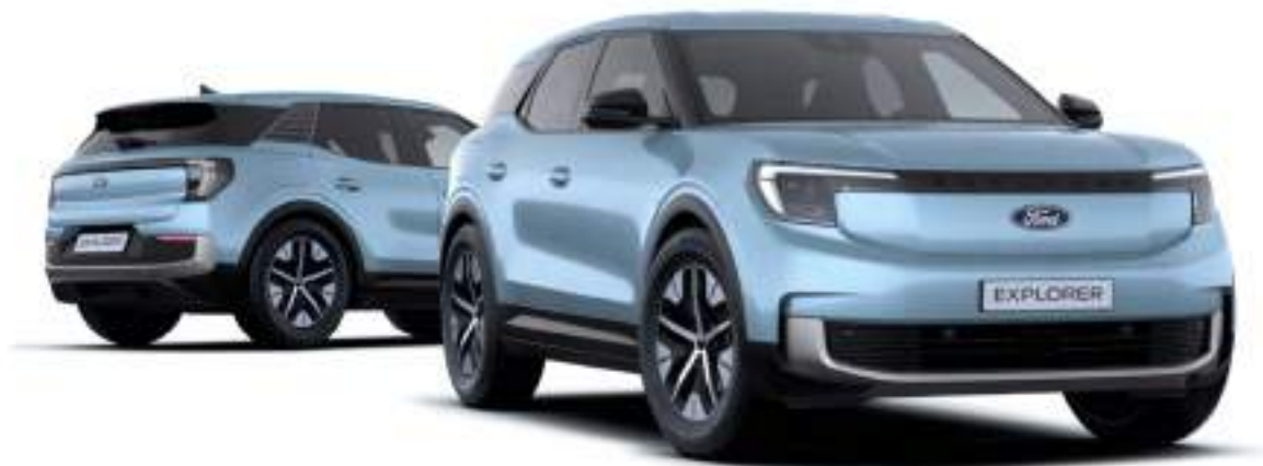
Nowy Ford Explorer w wersji Explorer z 19" obręczami ze stopów lekkich (standard dla wersji z bateriami o zwiększonej pojemności) oraz lakierem metalizowanym Artistic Blue (bez dopłaty)