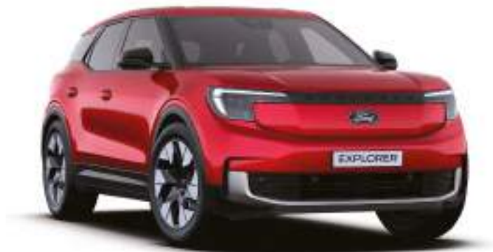
LUCID RED - LAKIER METALIZOWANY SPECJALNY 4 500 zł