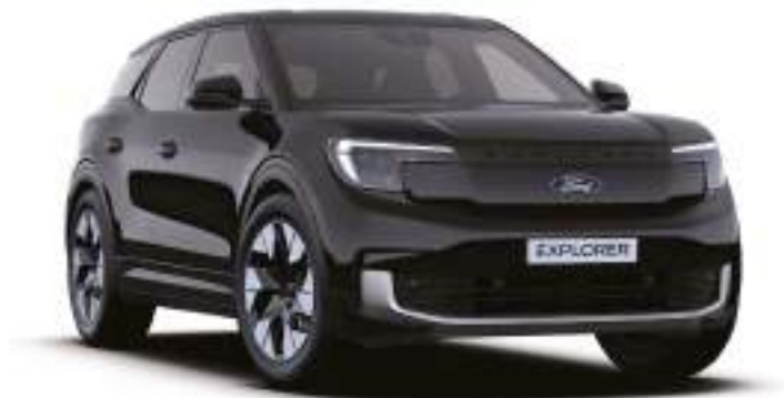
AGATE BLACK - LAKIER METALIZOWANY 3 000 zł