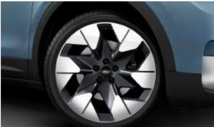
20" KOŁA ZIMOWE (4 SZTUKI) Z OPONAMI GOODYEAR ULTRAGRIP PERFORMANCE + 255/45R20 105 T XL (2 773 477) 10 036 zł