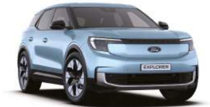
ARCTIC BLUE - LAKIER METALIZOWANY bez dopłaty