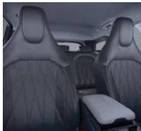
Nowy Ford Explorer w wersji Premium z tapicerką skórzaną - skóra ekologiczna Sensico (standard)