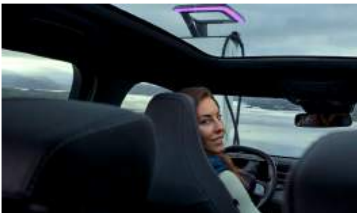
DACH PANORAMICZNY Opcja dla wersji PREMIUM