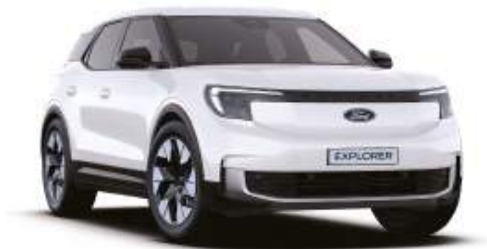
FROZEN WHITE - LAKIER ZWYKŁY 1 500 zł