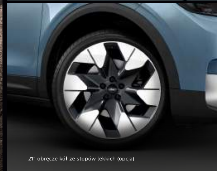
21" obręcze kół ze stopów lekkich (opcja)